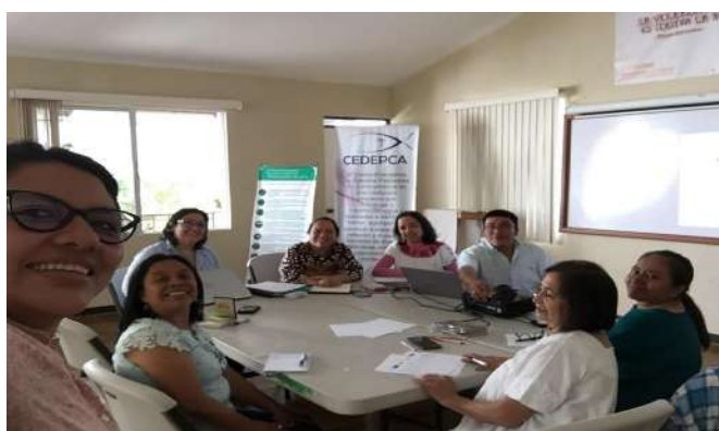
Taller de monitoras en Ciudad Guatemala 2019.

Los tres equipos de monitoreo: El Salvador, Guatemala y Costa Rica tuvieron conocimiento de este ejercicio regional. En estos tres países se realizaron los talleres de capacitación para una comunicación sin sexismo en los que participaron 65 personas. De las cuales 59 fueron mujeres y 6 hombres. Con cada equipo de monitores/as se hizo una discusión completa sobre la metodología. A la misma se le hicieron algunas valoraciones que luego fueron incorporadas en el GMMP 2020.