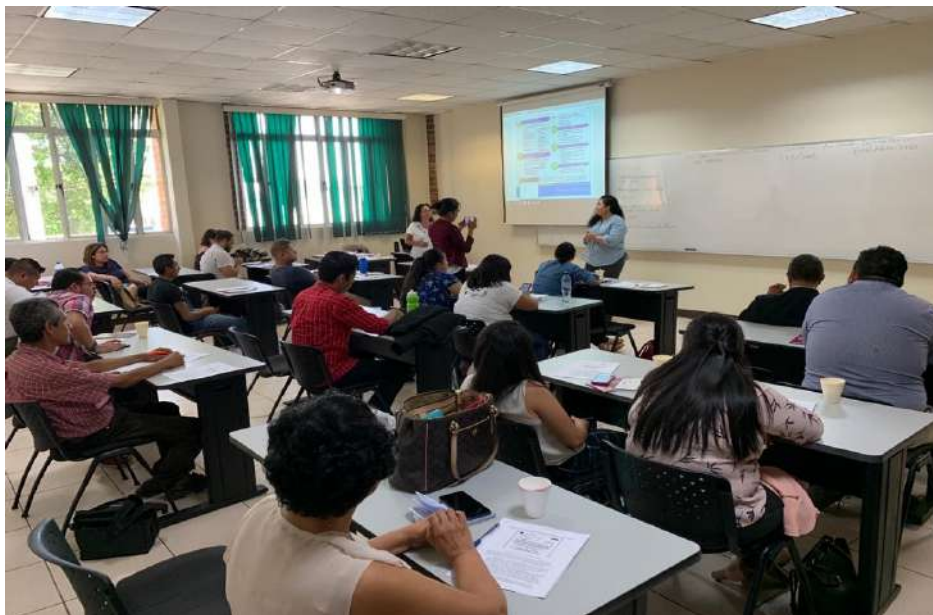
Taller con comunicadores y comunicadoras de ARPAS Y APES en la Universidad José Simeón Cañas (UCA) San Salvador 2019

Se formaron en lenguaje inclusivo y en los detalles del monitoreo global de medios a 72 comunicadores (53 mujeres y 19 hombres) y se les informó sobre el ejercicio regional de 2019 y del Monitoreo Global de Medios 2020.